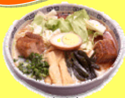
太肉麺 (ターローメン) ¥950

太肉麺 (ターローメン) ご注文のお客様に、お値段そのままあの「太肉(角煮)」を通常の 2倍 のせちやいます!!